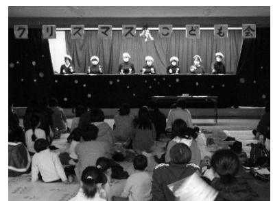
♪ 幻想的な音色のハンドベル♪